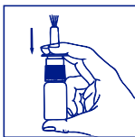
2. ....ist nur bei der ersten Anwendung mehrmals zu pumpen, bis gleichmäßiger Sprühnebel austritt.